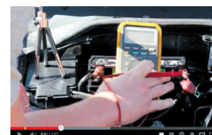
Guide til at tjekke bilen. YOUTUBE

»Jeg hørte for nylig om en, der havde repareret sin bil ved hjælp af YouTube, på trods af